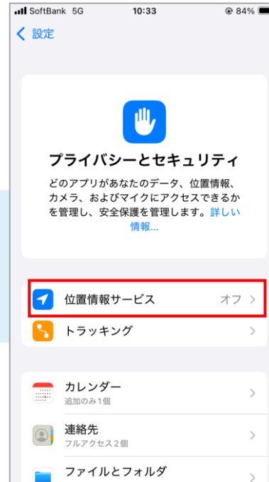
③位置情報サービスを選択