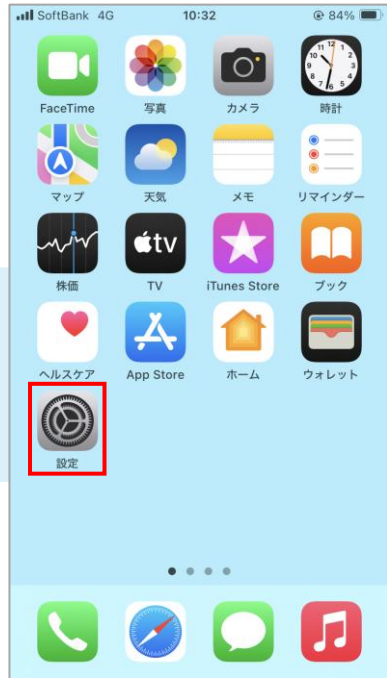
①ご自身の端末で設定を開く

設定→プライバシーとセキュリティ→位置情報サービスをオン (続けて次ページのアプリの設定を行います)