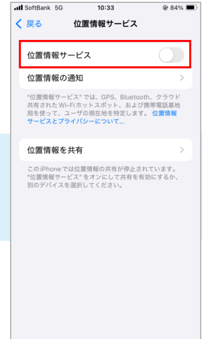
④位置情報サービスをオンにする